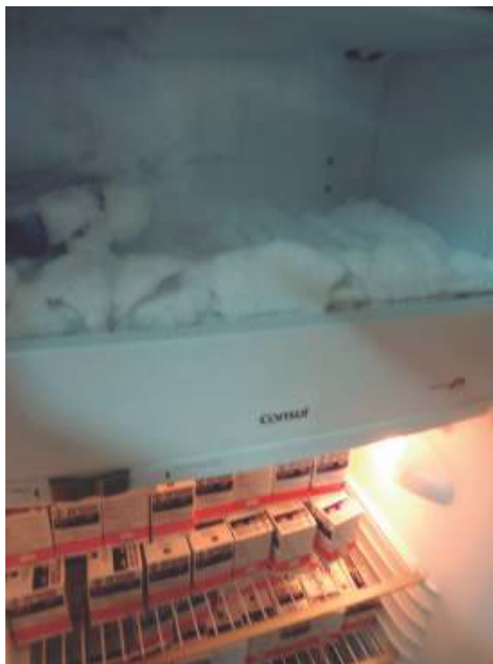
Figura 6. Excesso de gelo no congelador.