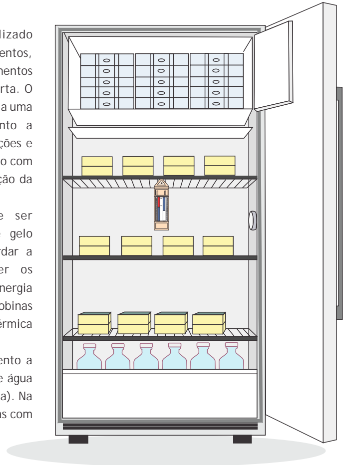
Figura 1. Organização correta do refrigerador. Observe que o congelador está preenchido com bobinas de gelo e a gaveta inferior com garrafas contendo água. O termômetro de mercúrio está posicionado ao centro, entre a primeira e a segunda prateleiras.

Os produtos devem ser dispostos nas prateleiras de modo a permitir a circulação de ar; para isso, devem-se manter as caixas afastadas da parede e com espaço mínimo de 2 a 3 cm entre elas. Na prateleira superior, devem ser colocados os produtos que suportem temperaturas negativas, o que não é o caso das insulinas. Ao sofrer congelamento, os cristais de insulina não se suspendem de forma apropriada, impedindo a retirada precisa da dose. Além disso, pode ocorrer uma maior aglomeração das partículas em suspensão, alterando a absorção da insulina a partir do local de aplicação. Assim, os fabricantes não recomendam o uso de produtos que foram congelados. Portanto, para evitar seu congelamento, insulinas devem ser armazenadas nas prateleiras inferiores.