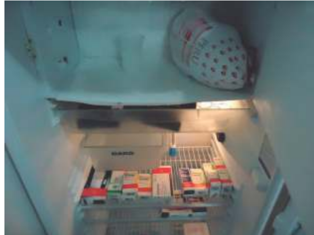
Figura 10. Presença de alimentos no refrigerador destinado ao armazenamento de medicamentos.