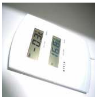
Figura 8. Refrigerador apresentando temperatura negativa.