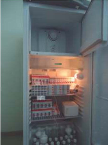
Figura 9. Medicamentos armazenados dentro de uma caixa de isopor e ausência de bobinas de gelo no congelador.