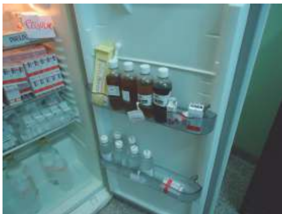
Figura 5. Medicamentos armazenados na porta do refrigerador e termômetro instalado na porta.

: Exemplos de irregularidades encontradas em inspeções :